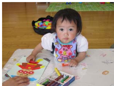
アンパンマンの貼り絵糊でペタペタ…上手にできたね。 (遊びの広場より)

6月は水無月（みなづき）です。 本来は、旧暦の6月のこと。 田んぼに水を張る「水の月」という意味と「梅雨が明けて水が涸れてなくなる月」という解釈の他、いろいろな説があるようです。 水無月が過ぎればいよいよ暑い季節…早めの体力づくりを心がけましょう。