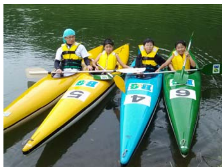
カヌー教室(福寿湖)