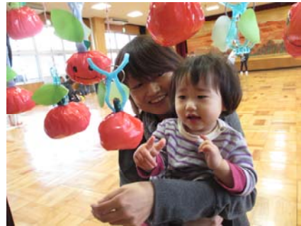
リンゴもぎゲーム。 「どれにしようかな！！」 (ふれあい広場…楽しく体を動かそう)

まずは、健康第一。前向きに明るい気持ちで過ごすことは、免疫力アップにもつながります。笑顔いっぱい の年になりますように！！