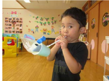
ストローでふーっ。あれ？ カップの中から「そうさん」がこんにちは!!