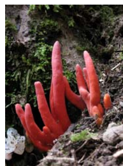
猛毒きのこ「カエнтаケ」

ナラ枯れ被害地にて、猛毒きのこ「カエнтаケ」の発生が確認されています。絶対に食べないでください。触れるだけで皮膚がただれる場合がありますので、絶対に直接触らないようご注意ください。