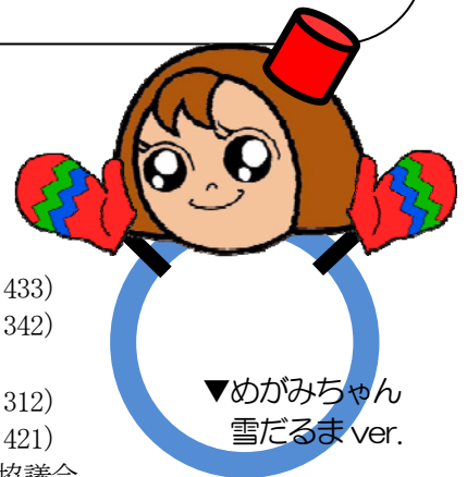
▼めがみちゃん 雪だるま ver.