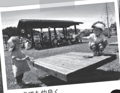
いつまでも仲良く