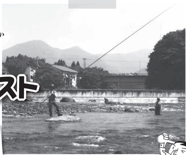
小国川と鮎人の父