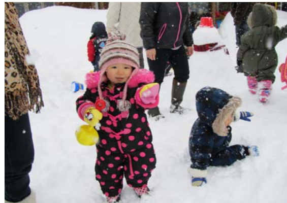
今日の雪はふわふわ、サラサラ とってもきれい

大寒に入り、本格的な寒さを迎えました。雪国ならではの楽しみを見つけながら厳しい季節を元気に乗り切りましょう。