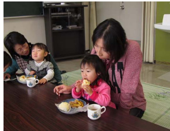
おやつづくり かぼちゃ饅頭 うま〜い!

来る新しい年は、明るいニュースの多い年になりますように…そして、たくさんの笑顔に出会えますように。どうぞ良いお年をお迎えください。