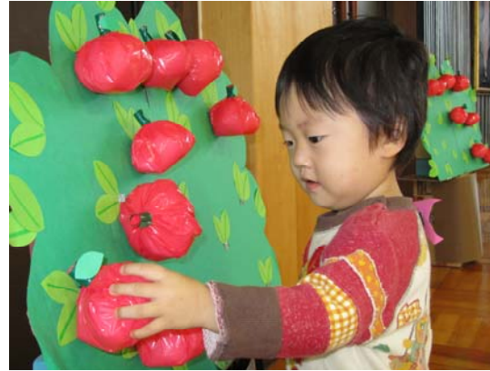
ミニ運動会 よ～いドン！ りんご、上手にとれるかな。

0から3歳は心の土台づくりの時期です。 子どもの自己評価は自己肯定感・自尊感情とも呼ばれるもので自分は大切にされていると感じる感覚のことです。1～3歳頃までに親にしっかり抱きしめてもらい絶対的な安心感と信頼感を教えてもらうことは、生きていくための自信、心の強さにつながります。 パパ、ママ、いっぱい抱っこしてあげましょう。いっぱい声をかけ、いっぱい遊んであげましょう。