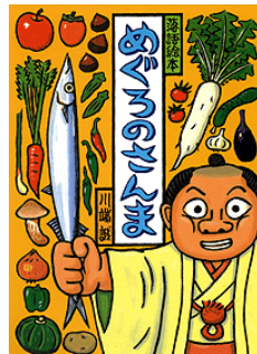
「めぐろのさんま」 (クレヨンハウス出版)