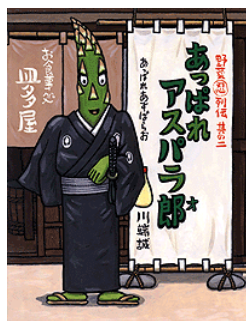
「あっぱれアスパラ郎」 (BL 出版)