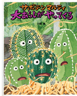
「サボテンマルチ大あしがやってくる」 (BL 出版)