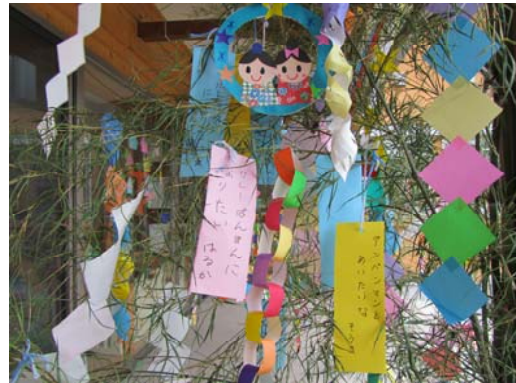
七夕かざり みんなの願いが叶いますように…

スポーツ飲料は運動時やたくさん汗をかいたときにおすすめの飲み物です。水分補給だからといって、炭酸飲料や甘すぎる飲み物を多量に摂り過ぎることはあまりおすすめできません。糖分の多い飲み物は、おやつと同じと考えて、時間と量を決めて飲むようにしましょう。