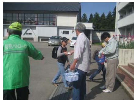
■ 5月 26 日「おはよう運動」