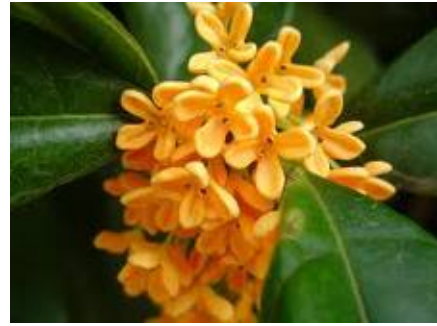
花ことば「謙遜」 キンモクセイ