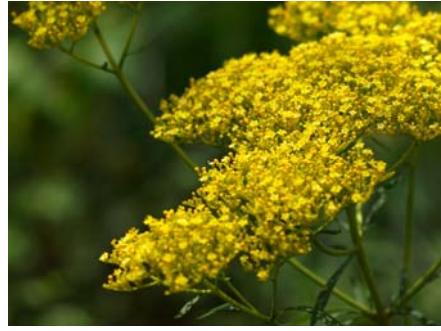
花ことば「心づくし」 オミナエシ