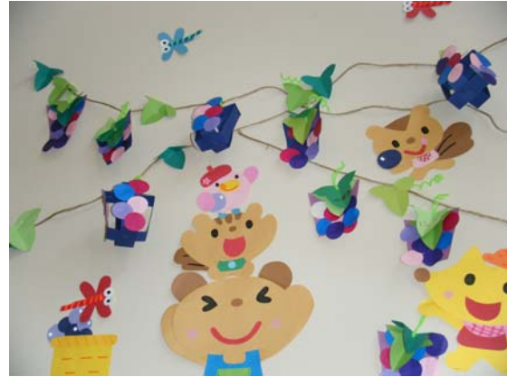
(製作) のりでペタペタ… 壁面にきれいなぶどうが たくさん実りました。

幼児が伝えたいこと、訴えたいことは、そ の時しかありません。「後でね。」は、自分が 拒否されたと感じてしまうこともあるよう です。子どもの話は、しっかりと受け止めてあ げましょう。