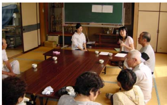
昨年の大平町内会での講演の様子