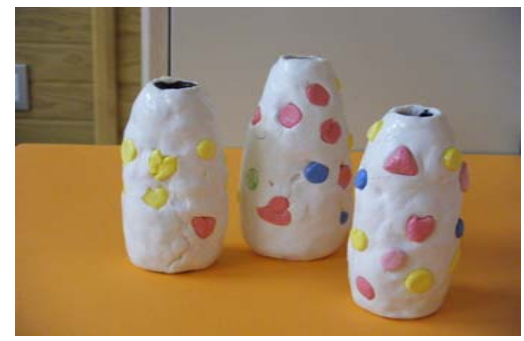
「遊びの広場」で作った紙粘土のかわいい花びん。「私が作ったの」と、にっこり。