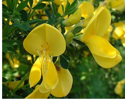
花ことば「エニシダ」 謙遜