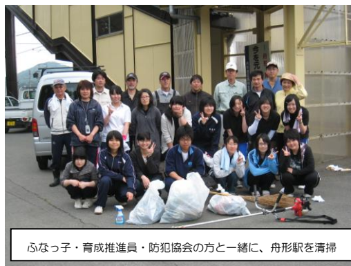
ふなっ子・育成推進員・防犯協会の方と一緒に、舟形駅を清掃