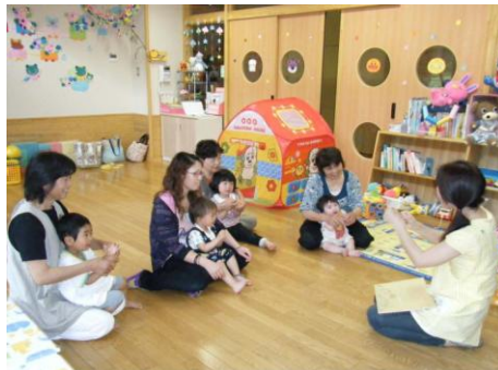
～おやつの手遊び風景～ 小さな赤ちゃんもとっても上手!!

7/6七夕飾りの製作…17組の親子が参加。短冊に書いたみんなの願いが叶いますように…。