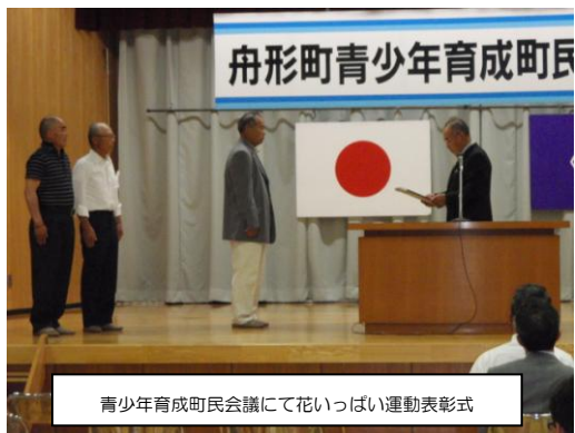
青少年育成町民会議にて花いっぱい運動表彰式

6月17日、中央公民館を会場に舟形町青少年育成町民会議総会及び青少年育成講演会が約100名の方の参加で開催され、今年度の青少年育成事業計画について話し合われました。