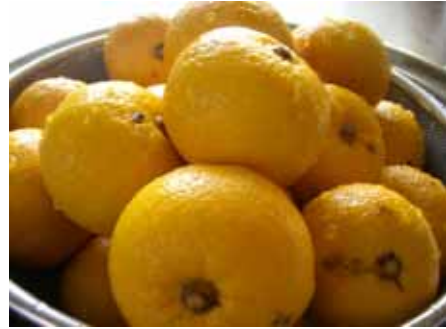
香りと酸味が特長の柚子は日本料理に欠かせない存在。冬至の日には風邪予防に柚子湯に入る風習も