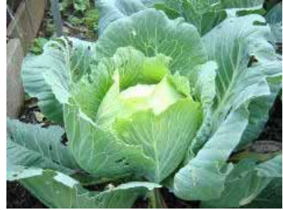
脇役の王様キャベツは、年中出ていますが、冬キャベツは球が締まっています、加熱すると甘味が増す