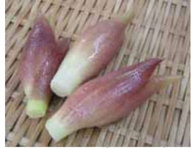
薬味として重宝されるミョウガ。夏ミョウガに比べ秋ミョウガは香り、辛みが一段と増しておいしくなります。