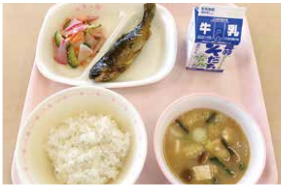
伝承野菜や郷土料理を取り入れた給食 「日本一のおいしい給食食育推進事業」