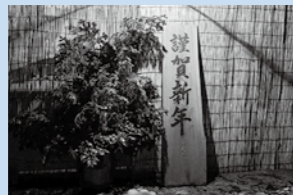
猿羽根山地蔵堂の初詣

また、大晦日から元旦の夕方まで、いつもお世話になっている猿羽根山地蔵堂でご奉仕をしました。普段のお正月ならお参りに行く側でしたが、まさか自分が参拝者をお迎えする側になるとは思ってもおらず、貴重な体験をさせていただきました。