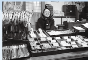
初詣の参拝者をお出迎え