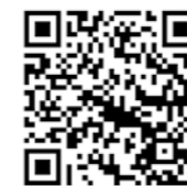
▲雨量モニタリングシステム

降雨量の情報をスマートフォンなどで確認できるため、早めの避難や備えに役立てることができます。町公式ホームページで公開しています。