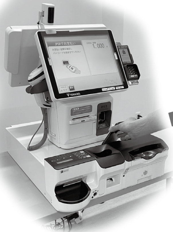
▲導入予定のセミセルフレジ

▼問い合わせ／舟形町住民税務課住民係 ☎(32) 0115 舟形町会計室 ☎(32) 2111 内線(361)