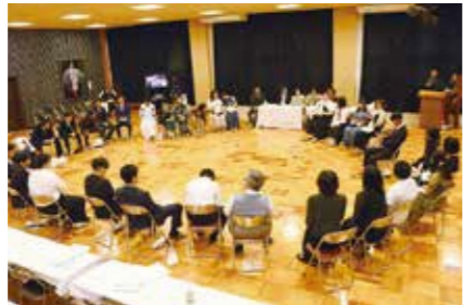
情報交換会の様子