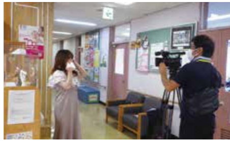
10年後の自分へのメッセージ