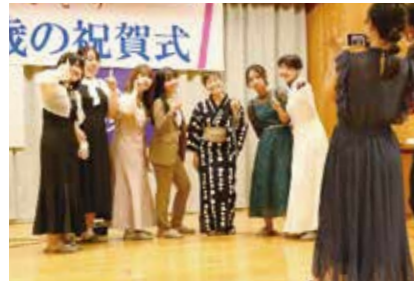
友人たちと写真撮影

式典終了後、祝賀式実行委員会主催の情報交換会が行われ、それぞれの近況報告や将来の夢について語り合っていました。また、二十歳の祝賀式対象者が小学校6年生の時に、二十歳の自分に向けて書いた手紙を開封しました。 ほかに、10年後の自分へのメッセージの動画撮影なども行われ、過去と現在、そして未来をつなぐ節目の式典となりました。