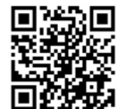
山形県HP (7月25日からの大雨関連情報)