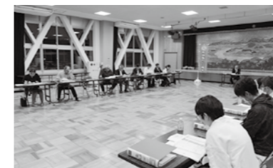
▲舟形町総合発展計画策定会議

この会議は、有識者10名とまちづくり審議会10名で構成される会議で、第7次舟形町総合発展計画の後期5年について6つの専門部会に分かれて意見交換がなされています。令和7年1月まで計5回の策定会議が開かれます。その後、後期短期アクションプラン最終案に対してののパブリックコメントを実施し、3月の町議会定例会に上程される予定です。