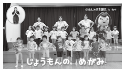
「ふながたのたからものたいそう♪」