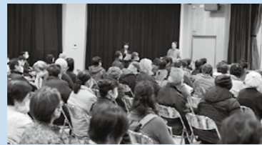
たくさんの方の前での報告会