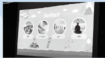
色々な企画ができそうです