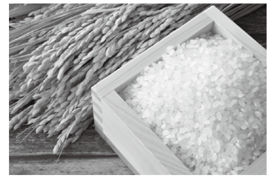
おいしい舟形町産の米

舟形町の場合は、ふるさと納税で町に1万円以上の寄付をされた方に、感謝の気持ちとして特産品などの返礼品を贈っています。返礼品には米や肉、アスパラガス、マッシュルーム、さくらんぼ、ラ・フランス、ドライフルーツ、山ぶどう酒、鮎の加工食品、木工製品などを用意し、希望に沿ったお礼を届けています。まごころのこもった返礼品はみなさんに喜ばれています。このうち、最も希望される方が多いのは舟形町産の米です。