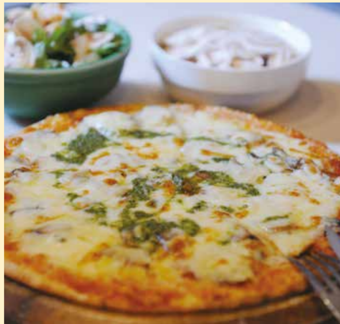
マッシュルームをたっぷり堪能できるマッシュルームスタンド舟形のランチ。生のマッシュルームをトッピングできます。

美味しさは、地域のにぎわいに 「良いものに出会うために人が『訪れる時代』になっている。それを確かめるように平成29年にマッシュルームスタンド舟形の経営に乗りました。喜ぶ顔が見たい、町の活性化につなげたいという想いが、舟形マッシュルームの新たな挑戦への原動力となりました。店に訪れる方はここでしか得られない体験をしつつ、地域にぎわいを与えてくれます。 良いもの、良い場所、そして、良い人。一人ひとりの挑戦が、未来を奏でて行くでしょう。