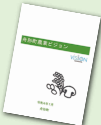
舟形町の農業総合戦略「舟形町農業ビジョン」

現在、実践的なスキルを身につけるため農業実習には、最上地域で61経営体が登録していますが、本町はうち15経営