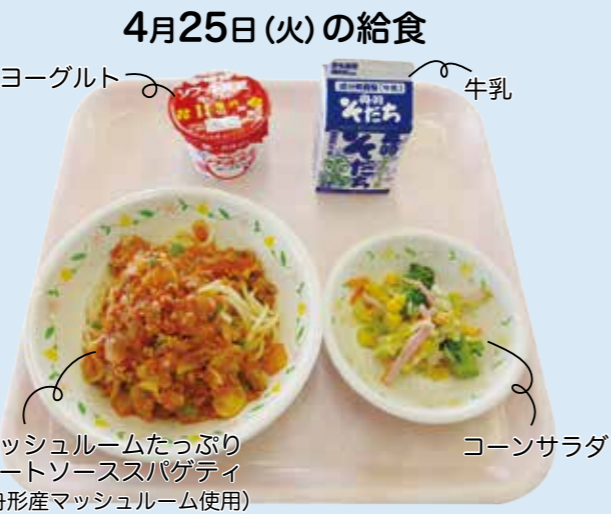
マッシュルームたっぷりミートソーススパゲティ(舟形産マッシュルーム使用)

舟形町母親委員会などからの要望を受け、毎日の給食の写真をInstagramで紹介しています。ぜひご覧ください。