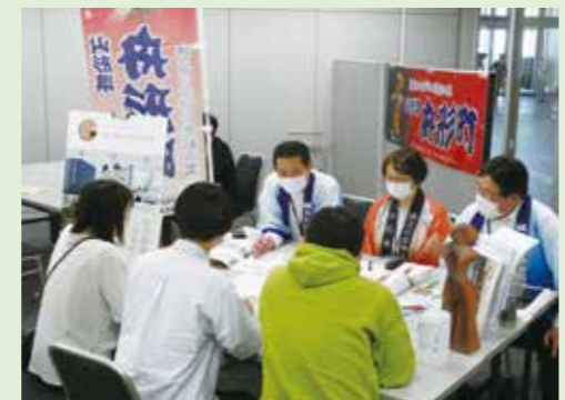
オープンキャンパスへ参加