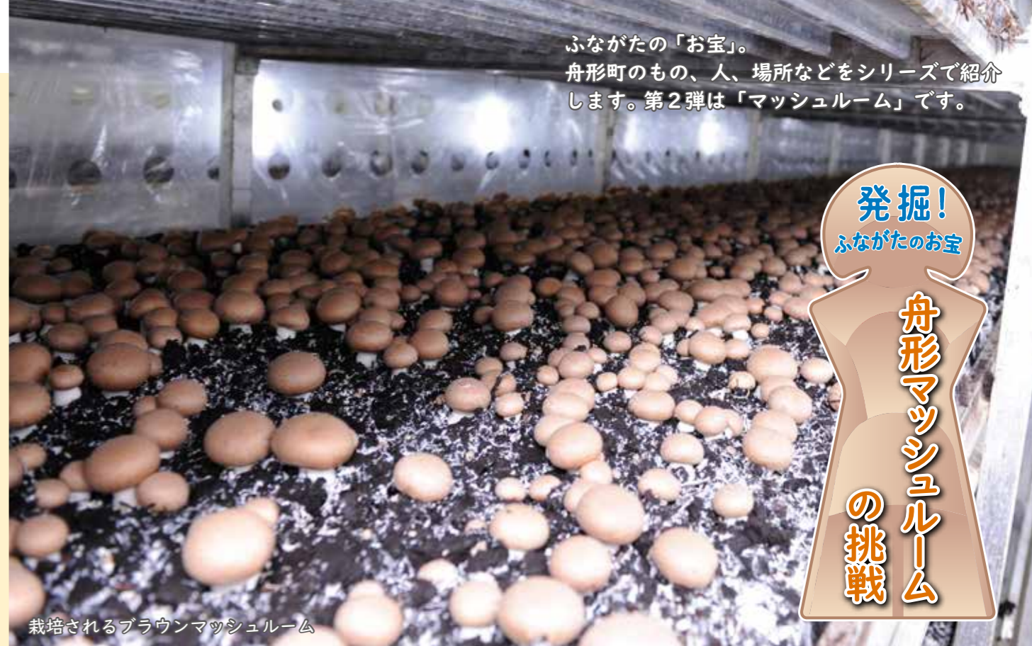
ふながたの「お宝」。舟形町のもの、人、場所などをシリーズで紹介いたします。第2弾は「マッシュルーム」です。