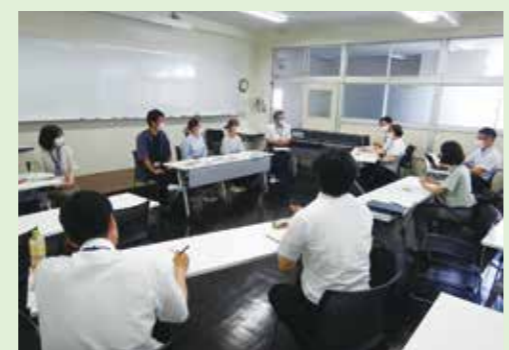
静岡県での貴重な研修

町では専門職大学と連携をすることが将来に向けて必要と考え、東北農林専門職大学総合プロジェクトチームを結成し、令和3年5月から活動しています。 メンバーは若手職員を中心に構成され、所属部署にとらわれず、横断的に参加し、それぞれの強みを活かしながら活動しています。 現在は、開学に向けた町の取組みを紹介するパンフレットやホームページの作成、オープンキャンパスへの参加や高校への訪問によるPR活動を行なっているほか、研修も積極的に実施し、学生が求める支援のニーズ調査をしています。