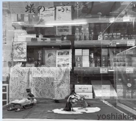
洲崎にある沢内商店は見どころがいっぱい！

舟形町には熱中人が多いなと感じました。いやあ、舟形町はいいところだっちゃあ（これは仙台弁です）。