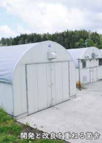
開発と改良を重ねる菌舎

有機栽培と持続可能な生産工程 舟形マッシュルームが誇るの、守り続ける有機栽培と持続可能性の高い生産工程です。平成30年3月に、有機農産物JAS認証(※)を取得しました。 生産されるマッシュルームはすべて合成堆肥などを使わず生産し、安全でおいしいマッシュルームを提供しています。また、生産するだけでなく、使用された培地の廃床菌をも商品化し、廃棄物を出さない、循環型農業に取り組んでいます。その一つが、発生した汚水の処理で、同社が自家消費型排水処理システムと呼んでいるシステムで、汚水再利用化用のタンクに集積し循環させる方法です。すべての汚水が貴重な副産物として再利用され、ふくよかな堆肥を製造しています。 ※農薬や化学肥料などの化学物質に頼らないことを基本として自然界の力で生産された食品。