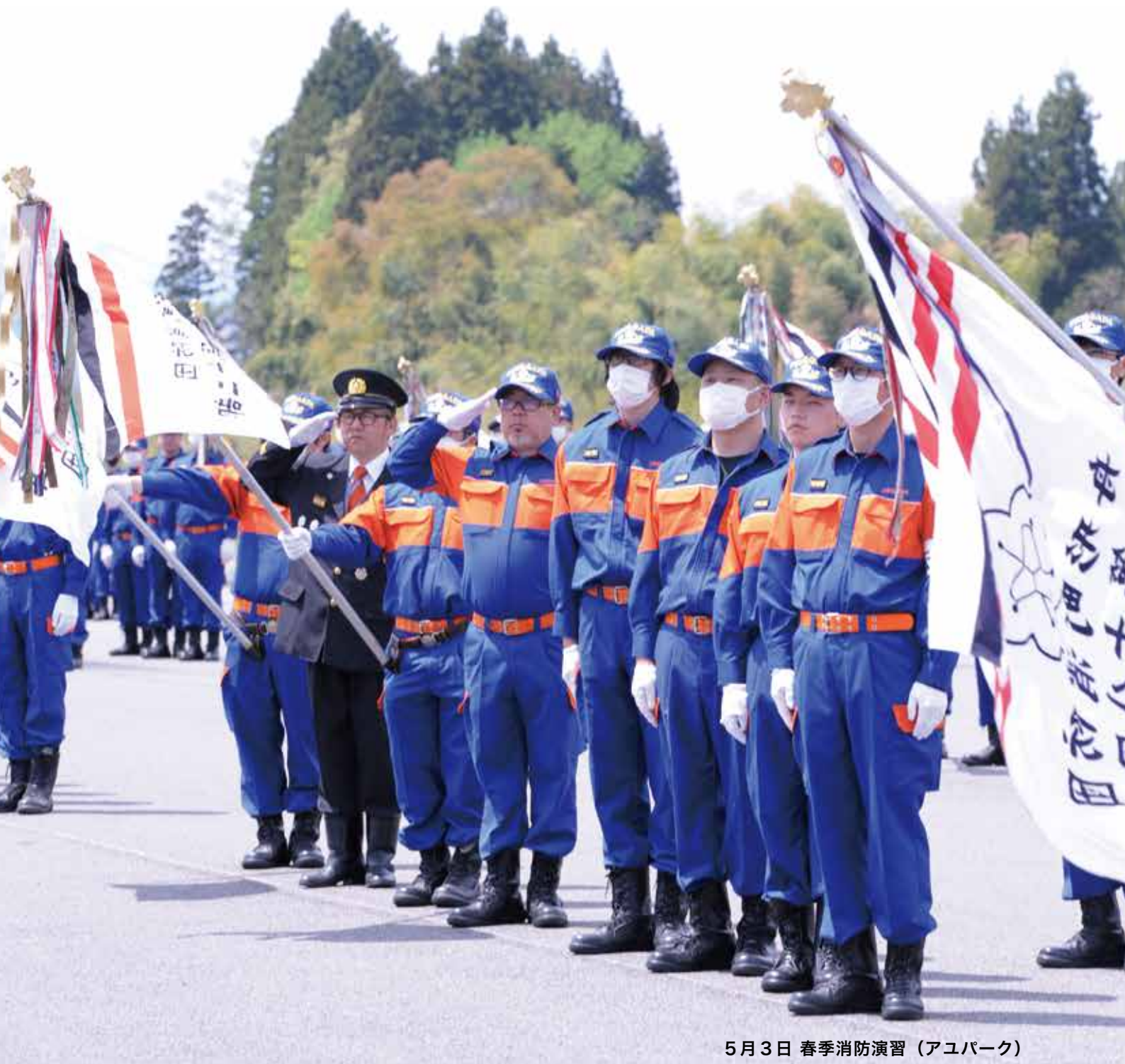
5月3日 春季消防演習（アユパーク）