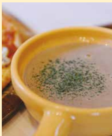
濃厚マッシュルームのポタージュ(マッシュルームスタンド舟形のメニュー)

また、舟形マッシュルームが山形工業技術センターと共に開発したマッシュルームスープの素には、ストレスの軽減や、リラックス効果が期待されるGABA(ギャバ)が多く含まれています。