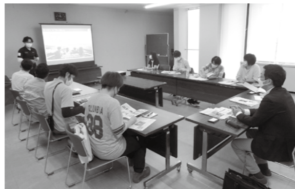
先進地視察研修（上山市）