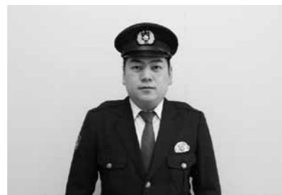
▶長沢駐在所に着任しました。町の安全のためにがんばります。