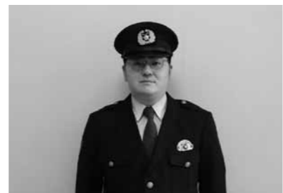
▶舟形町駐在所に着任しました。町の安全のためにがんばります。