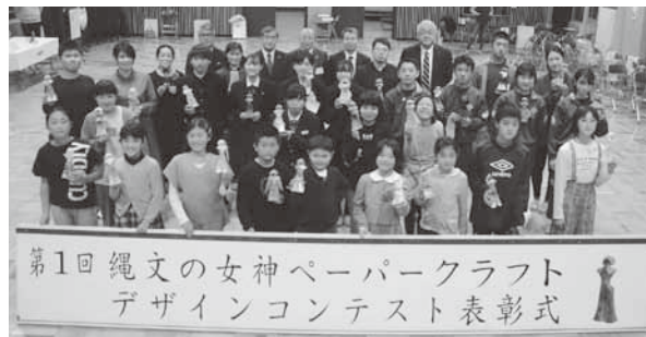
第1回 縄文の女神ペーパークラフト デザインコンテスト表彰式

国宝土偶「縄文の女神」やイメージキャラクター「めがみちゃん」の登場機会を増やし、広く情報を発信することで、「縄文の女神の郷 舟形」の認知度向上を図ります。また、毎年開催している縄文の女神まつりや、今年度初めて行なった縄文の女神ペーパークラフトデザインコンテストをとおして、「縄文の女神」出土地としての町民気運を高め、「おかえり女神プロジェクト」の推進を図ります。