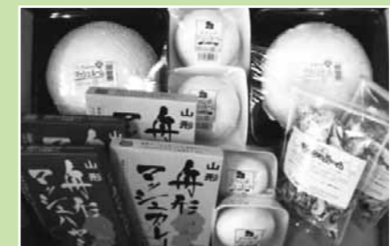
舟形マッシュルーム