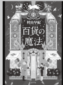
百貨の魔法 村山 早紀 / 著

もうすぐ春が来るはずが、街はまだ灰色。「自分たちで街を春にしよう」という男の子の一声で街中に春を描いていきます。自分の力で春を呼び込もうとする人々の姿に、前向きになれます。