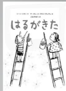
はるがきた ジーン・ジーン / 著

もうすぐ春が来るはずが、街はまだ灰色。「自分たちで街を春にしよう」という男の子の一声で街中に春を描いていきます。自分の力で春を呼び込もうとする人々の姿に、前向きになれます。