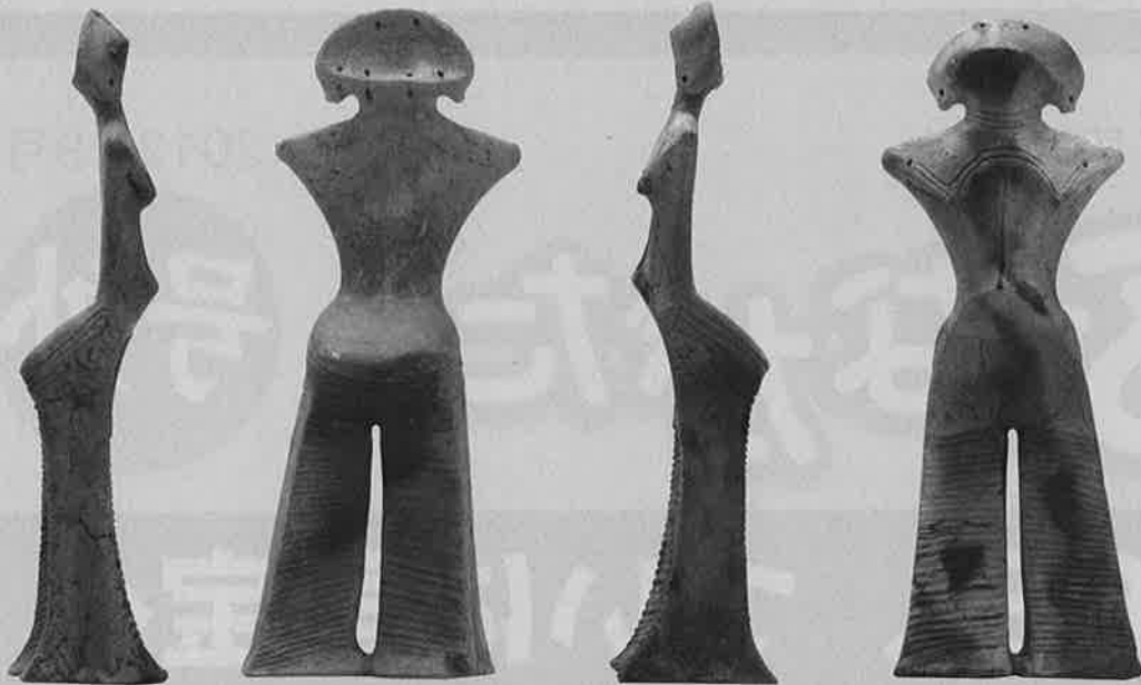
右 後 左 前