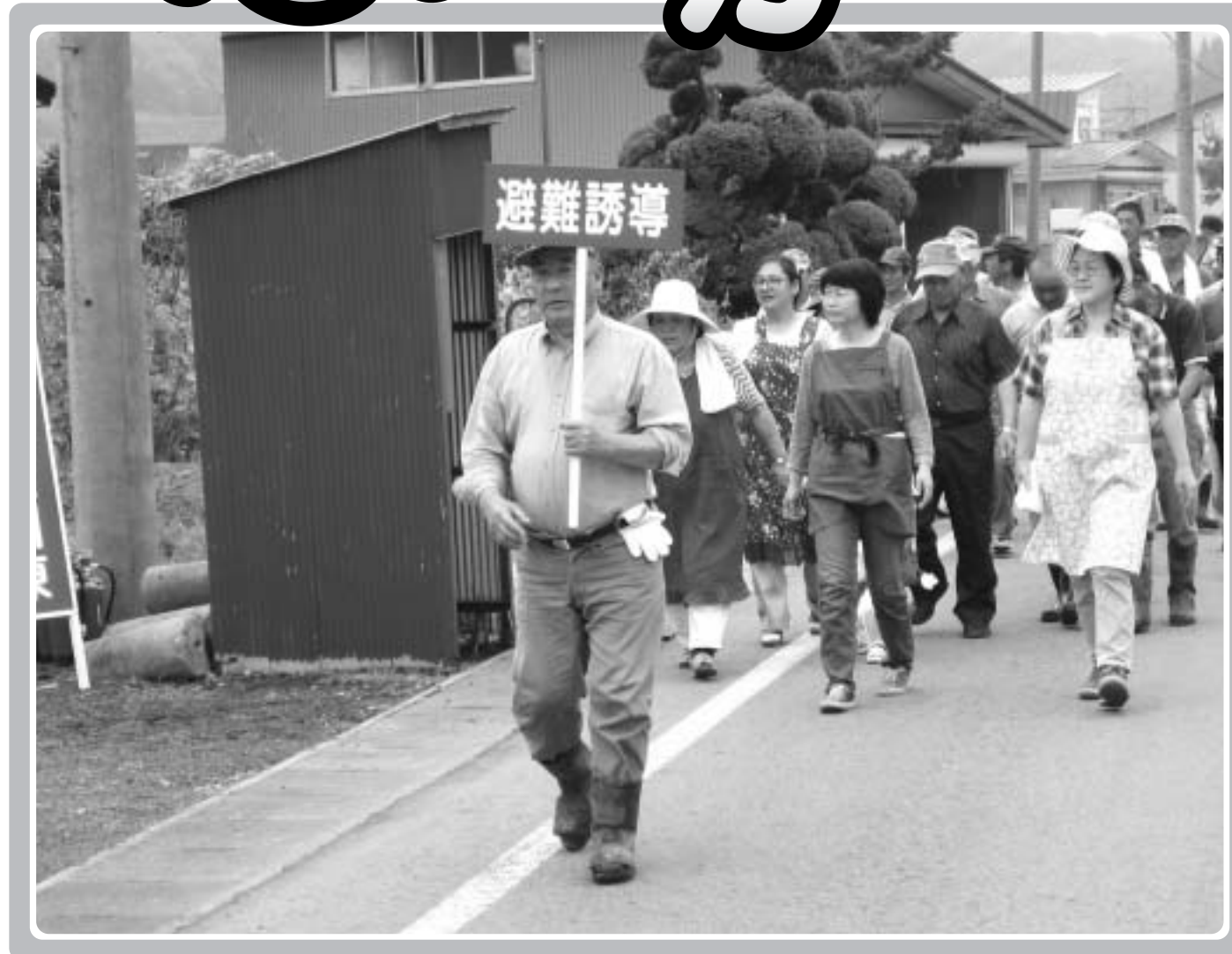
真木野・新堀地区 夏季非常招集訓練