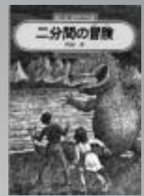
「二時間の冒険」 岡田 淳 / 著

6年生の悟が体育館をぬけだして、ふしぎな黒ネコに出会つた時から、悟の、長い長い二時間の大冒険が始まります。昭和60年度うつつのみやこども賞受賞。