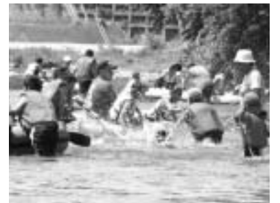
7月13日、今年度第2回目となる長沢子ども遊々塾が行われ、真夏日という、絶好の川遊び日和の中、小国川での川遊びを満喫しました。