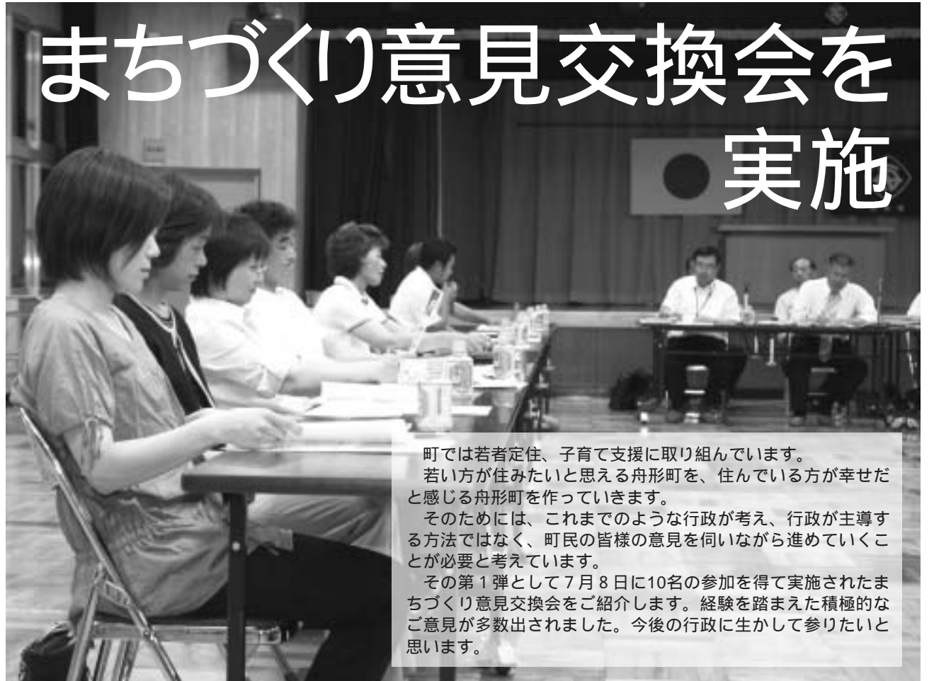
町では若者定住、子育て支援に取り組んでいます。若い方が住みたいと思える舟形町を、住んでいる方が幸せだと感じる舟形町を作っていきます。そのためには、これまでのような行政が考え、行政が主導する方法ではなく、町民の皆様の意見を伺いながら進めていくことが必要と考えています。その第1弾として7月8日に10名の参加を得て実施されたまちづくり意見交換会をご紹介します。経験を踏まえた積極的なご意見が多数出されました。今後の行政に生かして参りたいと思います。