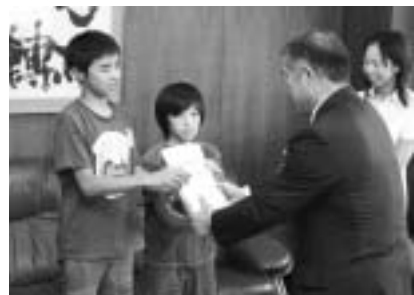
舟形小学校ボランティア委員会が中心となり、岩手・宮城内陸地震への義援金11,188円を集めてくれました。ご協力本当にありがとうございます。