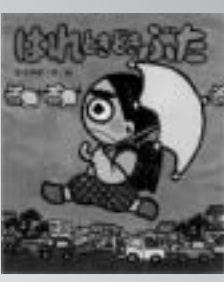
はれしきどきぶた 矢玉四郎 / 作・絵

6年生の悟が体育館をぬけだして、ふしぎな黒ネコに出会つた時から、悟の、長い長い二時間の大冒険が始まります。昭和60年度うつつのみやこども賞受賞。