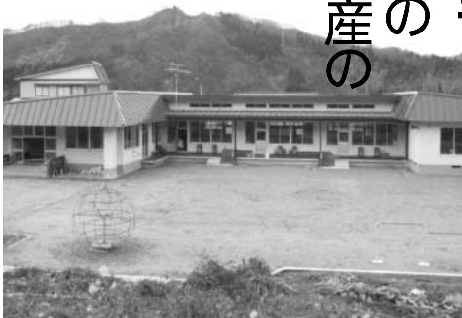
懸案の意味 『前から問題になっていながら、まだ解決されていない事柄』

長沢地区には八鍬林業第2工場跡地や長沢保育所、内山地区宅地造成地などの遊休町有地があり、その利活用が町や地域の懸案課題となっています。これまでの経過や動き、今後の検討すべき内容などについて、12月に長沢地区の全戸を対象に実施したアンケート調査をもとに今後検討を行なっていきます。