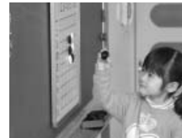
2月13日、南部保育所で「石取り遊び」が行われました。先を読み、次の手を読むこの遊びで、考える力を育てます。