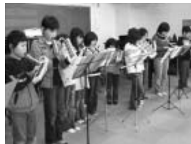
各小学校の9名からなる器楽クラブ。自分が持っている身近な楽器で楽しく演奏するクラブです。現在、来年度の参加者を募集中です。