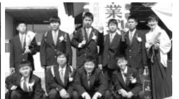
9人の仲間と共に(富小)