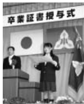
6年間の思い出(堀小)