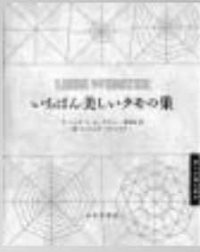
いちばん美しいクモの巣 アイシユラキ ルックウィン著

30人以上のタイトルホルダー を育てあげた天才打撃コーチが、 教え子たちの心に残したも のとは。「読みました。泣きま した。こんなにすばらしい野球 人がいたことを、1人でも多く の方に知ってほしい」長嶋茂雄 氏も大絶賛！