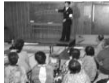
3月7日、交通事故を防止しようと長者原地区で約43名が参加し、交通安全講習会が開催されました。