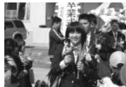
アーチの中を晴れやかに(富小)