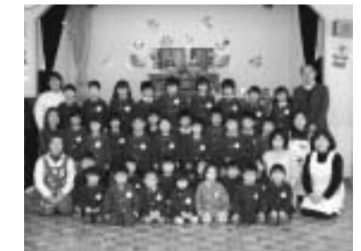
3月3日の桃の節句に併せ、各保育所でひなまつりが行われました。こうした伝統をいつまでも大事にしていきたいですね。