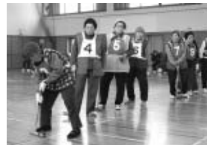
3月14日、生涯学習センターで冬季ゲートボール大会が行われました。8チーム約50名が日頃の練習の成果を発揮していました。