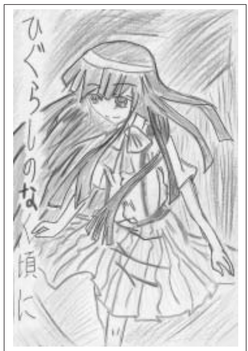
イラスト: 曾根田 唯ちゃん(長者原)

また、この期間中に家庭ごみを自己搬入される方に対し、ごみ処理施設の特別開場日を設けます。 日時/12月29・30日、1月3日 午前8時30分~午後4時(正午~午後1時は除く) 料金/10kgあたり140円 場所/可燃ごみ(エコプラザもがみ) 鮭川村川口 22-3838 不燃ごみ(リサイクルプラザもがみ) 舟形町太折 32-2042