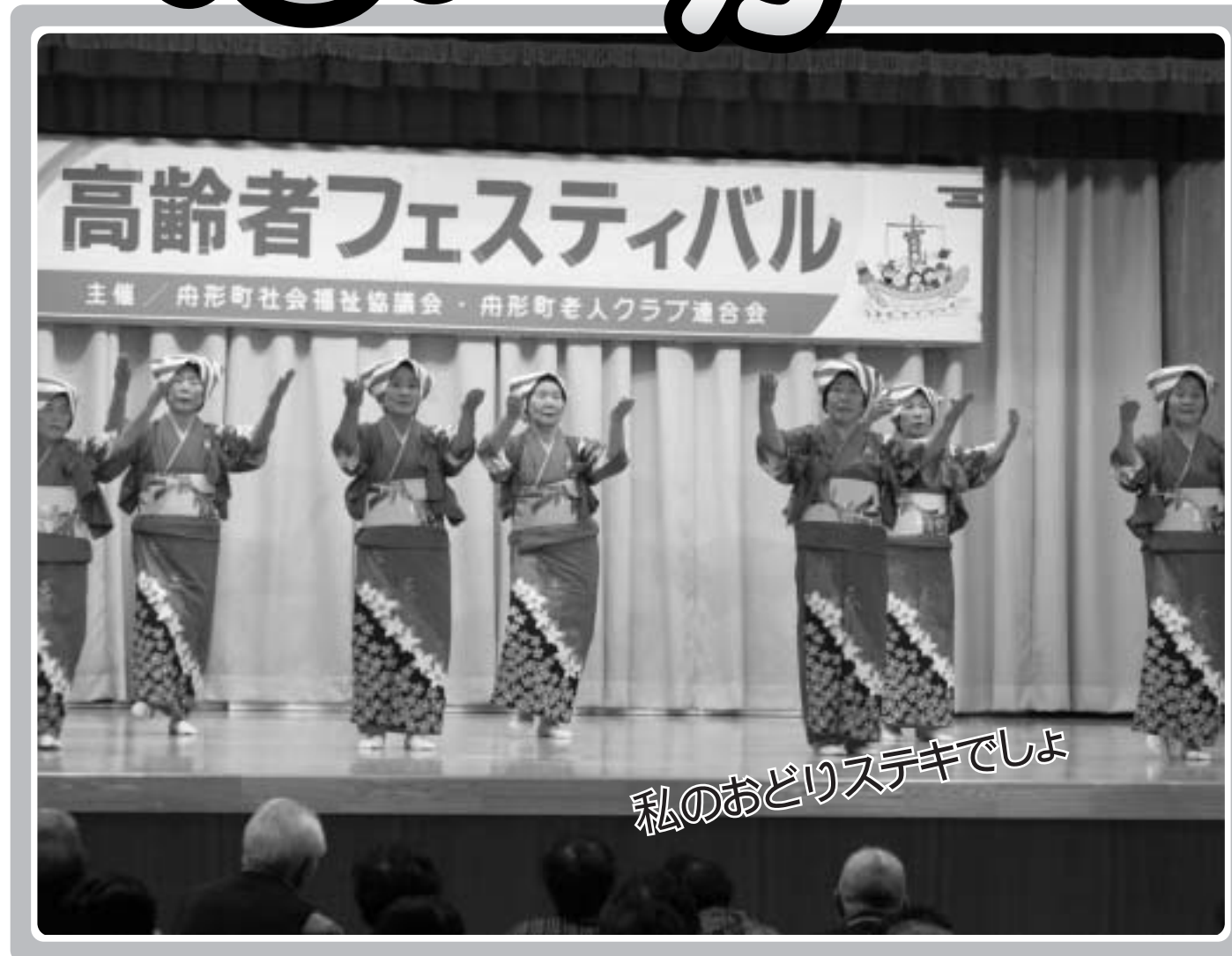
'06 高齢者フェスティバル