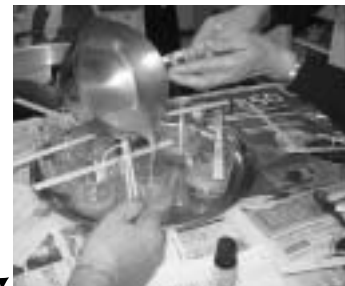
11月20日、食生活改善推進協議会で廃油を使った「ろうそくづくり」を行いました。油は捨てればやっかいなゴミ。リサイクルできれいなろうそくに变身です。