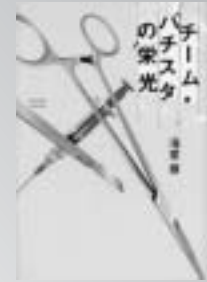
「チーム・パチスタの栄光」 海堂尊 著

教育、家族、人間関係、進路など、「国家の品格」で日本のあるべき姿を説いた著者が、日本人の悩みに答えます。