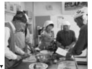
11月1日、食生活改善推進協議会主催の「男性の料理教室」が開催されました。今回が初めての企画でしたが、11名が参加し大好評。さばの味噌煮、きんぴらごぼうなどの家庭料理に挑戦しました。