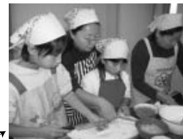
11月19日、食生活改善推進協議会と舟小母親委員会の共催で「おやこ食育教室」が実施され、舟小の親子が大勢参加し、食生活の学習と料理づくりを体験。おそろいのパンダなをかぶり、ラップごはん、サラダなどを作りました。