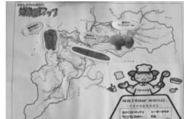
舟形町の地図に、食材の写真を貼って、どこで生産されたものなのかを掲示しています。

食の大切さが見直されている現在、地産地消が注目されています。学校給食でも毎月19日に、町内でとれたものを使っての特色あるメニューが出されています。これまで、鮎、マッシュル