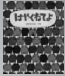
「はやくねてよ」 あきやまただし 著

「早くねてよ。」お母さんの切実な願いです。主人公のこうたろうくんは、早く寝るためにブタを数え始めますが……。 絵も味があって、つい声を出して笑ってしまう面白い本です。'95日本絵本大賞受賞作品。