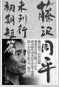
「藤沢周平 未刊行の初期短篇」 藤沢周平 著

「早くねてよ。」お母さんの切実な願いです。主人公のこうたろうくんは、早く寝るためにブタを数え始めますが……。 絵も味があって、つい声を出して笑ってしまう面白い本です。'95日本絵本大賞受賞作品。