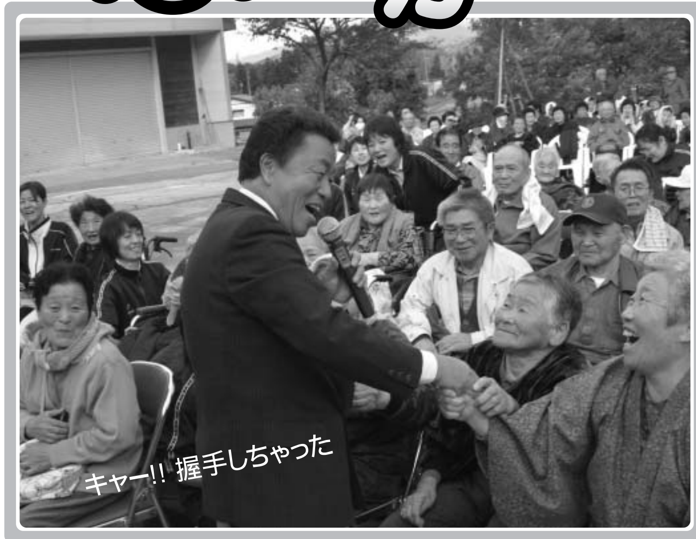
キヤー!! 握手しちゃった