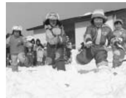
1月27日、南部保育所で『おさいど』が行われ、親や近所の方も参加し、にぎやかに開催されました。