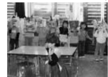
2月3日、各保育所で豆まきが行われ、かわいいお面の鬼たちに「鬼は外、福は内」のかけ声が響いていました。(舟形保育所)