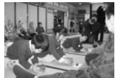
1月27日、長沢保育所の年長9名が遊楽館を訪れ、お点前を披露しました。