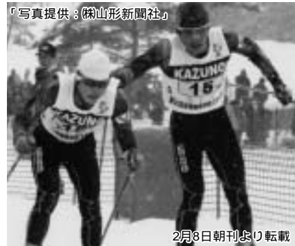
2月8日朝刊より転載