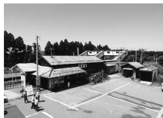
平成4年(1992年) 舟形駅、旧駅舎。 翌年、現在の駅舎に建替となる。