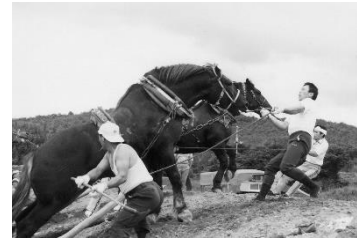
昭和62年(1987年) 第1回東北鞍馬競技大会開催。