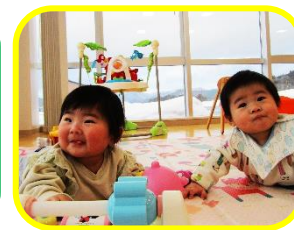
0歳児のお友だちが大集合♪