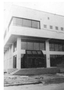
昭和49年(1974年) 町中央公民館新築。