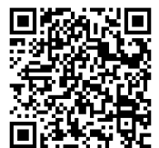
おさがり会について