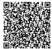
おさがり提供申込