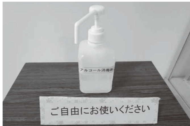
庁舎内各所に設置されているアルコール消毒剤(議場前)