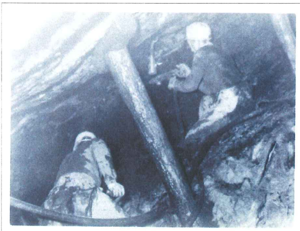
木友炭鉱実栗屋坑内